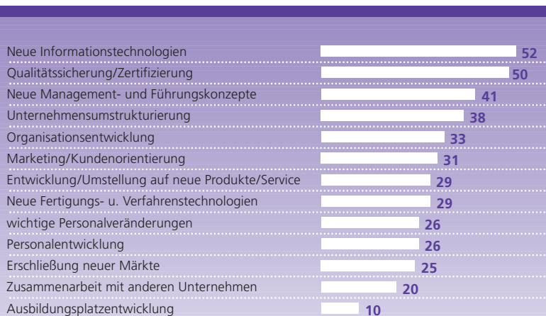
Abbildung 1 Bereiche betrieblicher Entscheidungen, in denen Beratung in Anspruch genommen wurde (in Prozent)

(ohne fehlende Angaben; Mehrfachnennungen)