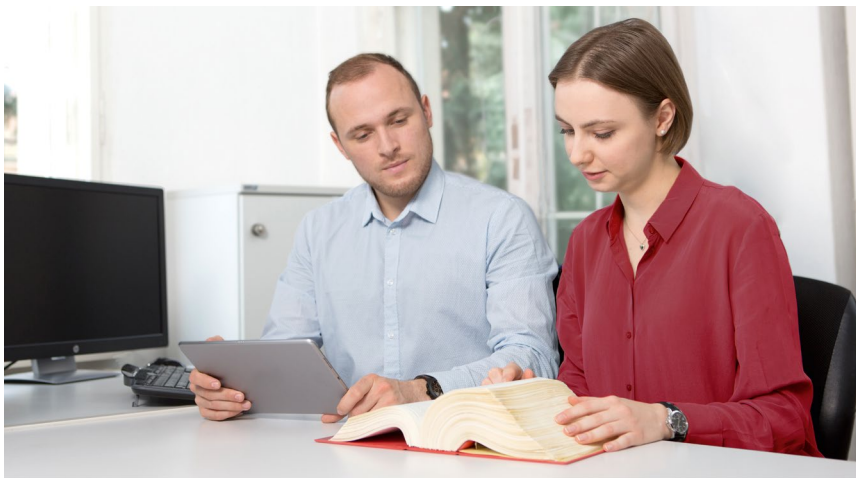
Zwei Auszubildende Steuerfachangestellte in einer Kanzlei

Die Entscheidung für eine Ausbildung in diesem Beruf legt den Grundstein für vielfältige Karrierewege bis hin zum Steuerberaterexamen. Neben Zahlenverständnis und Gewissenhaftigkeit ist die Affinität zu digitalen Arbeitsweisen zunehmend wichtig. Der Steckbrief beschreibt die Aufgaben, nennt Zahlen zur Ausbildung und stellt fest, dass Steuerfachangestellte häufig sehr zufrieden mit ihrer Ausbildung sind.